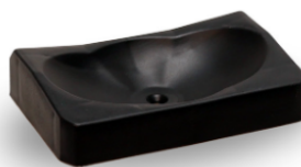
145 mm x 95 mm